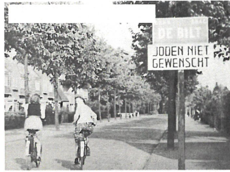
Juni 1941—door de anti-Joodse maatregelen mogen Joden niks meer en raken steeds verder geïsoleerd.