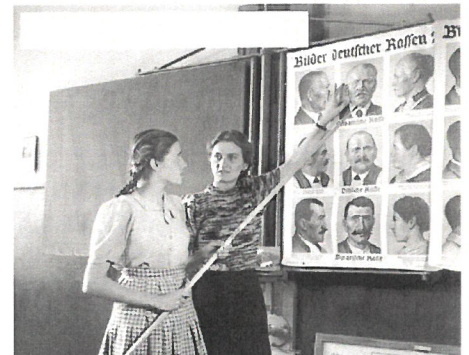
1943—Een Duitse leerling krijgt het verschil tussen Ariërs en Joden uitgelegd, deze ideologie van de superioriteit van de Duitsers lag ten grondslag aan het nationaal socialisme.