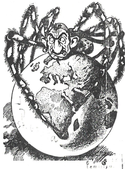
1934—Dit voorbeeld laat het vooroordeel zien hoe Joden uit zijn op macht. Ze worden vergeleken met ratten, spinnen en ander ongedierte.