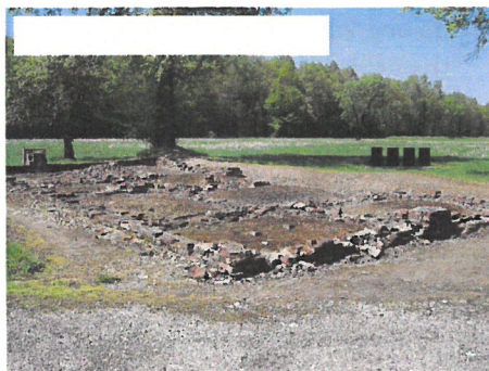
Auschwitz Birkenau, restanten van een gaskamer en crematorium. Vlak voor de bevrijding blazen de nazi's de gaskamers en crematoria op.