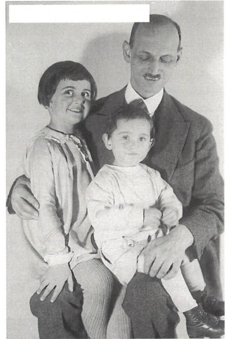
1931—Otto met zijn dochters Margot (L) en Anne (R). De familie Frank is Joods.