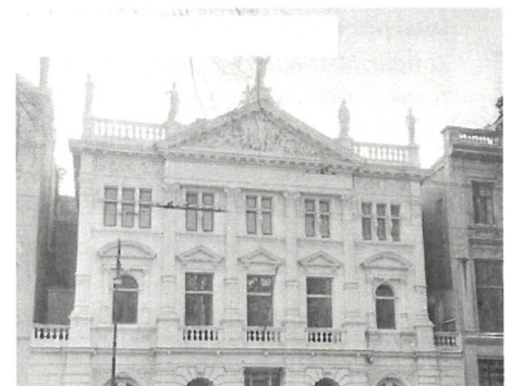
1943—Joden worden naar de Hollandsche Schouwburg gebracht voordat zij naar het doorgangskamp Westerbork worden gestuurd. Voorafgaand moesten zij al hun bezittingen inleveren en gedwongen in Joodse wijken wonen.