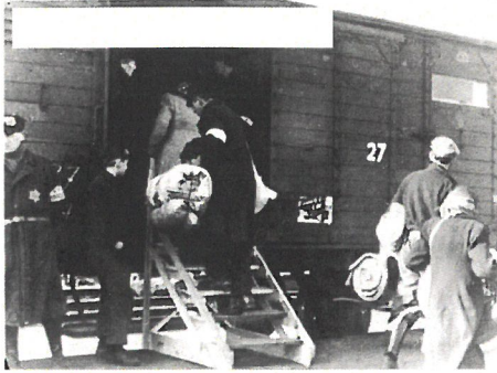
1943—Transport vanuit Westerbork. In totaal zijn er 97 transporten naar de vernietigingskampen gegaan van 15 juli 1942 t/m 13 sept 1944.